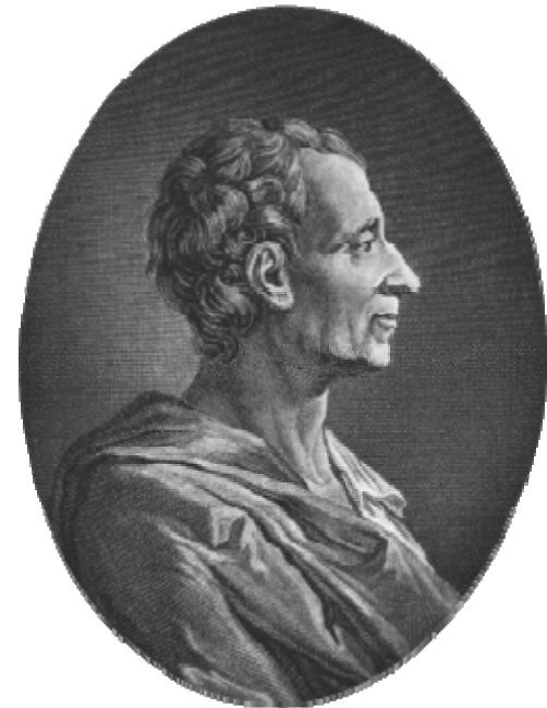
Charles Louis de Secondant Baron de Montesquieu