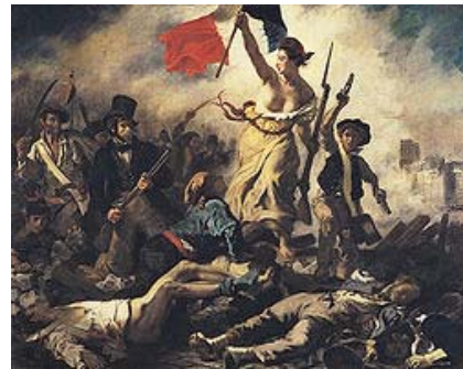
Declaración de la libertad